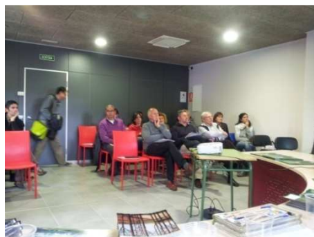
Vista de part dels assistents a la assemblea ELFOCAT del 25 març 2014 de Montferrer