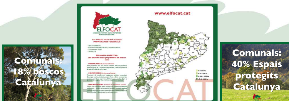
Alguns dels pòsters exposats a la Fira de la Biomassa a Vic