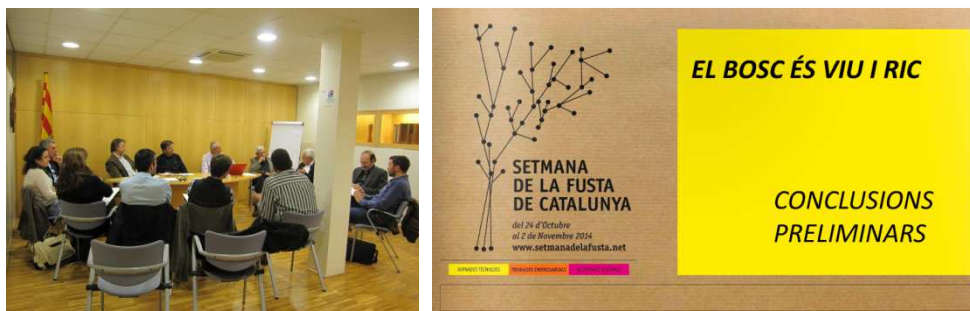
Vista de una de les reunions del projecte, i portada de les conclusions presentades a la Setmana de la Fusta de Catalunya (29 octubre de 2014)

comercialització final. Es pretén que el projecte tingui continuïtat i pugui ajudar a dinamitzar la comercialització de la fusta procedent dels boscos catalans.