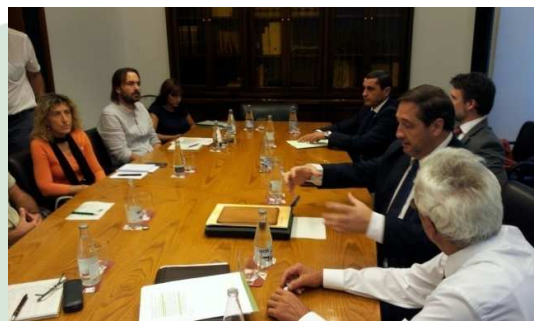
Vista d'alguns moments de la junta d'ELFOCAT del 3 octubre de 2014 a Girona