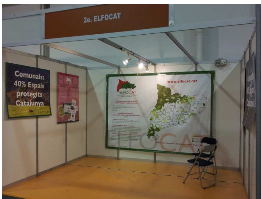
Visió del estand institucional d'ELFOCAT a la 3a Fira de la Biomassa a Vic, febrer de 2014